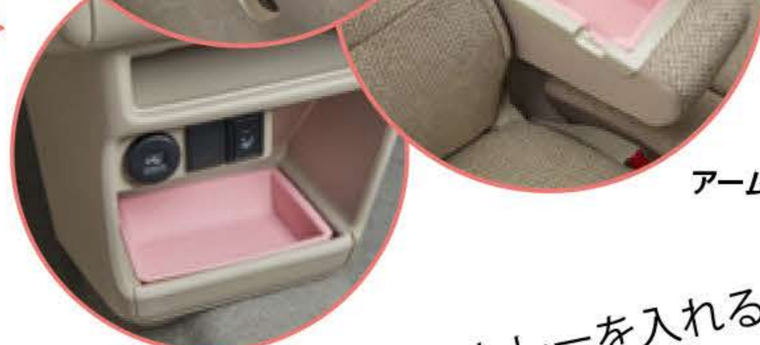
アームレストボックストレー