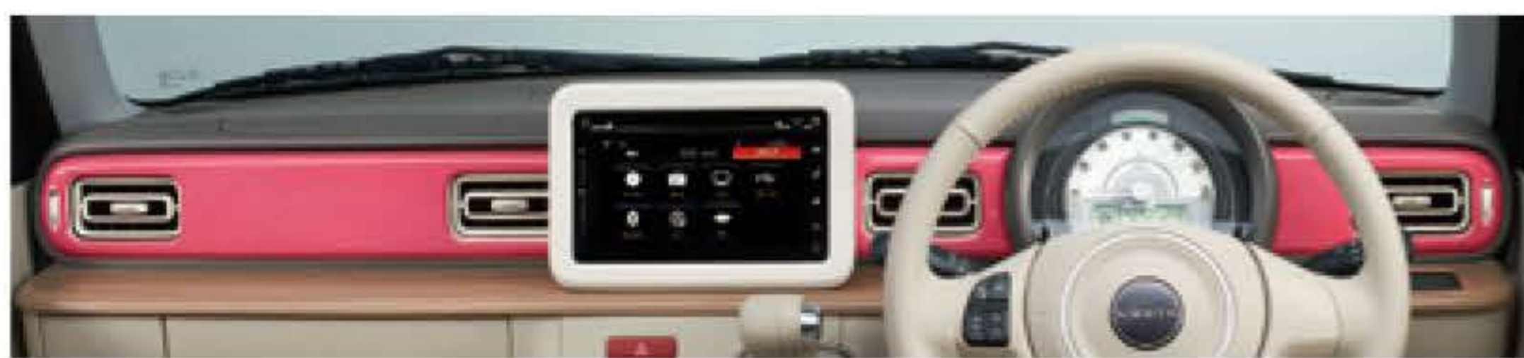
キャンディピンク