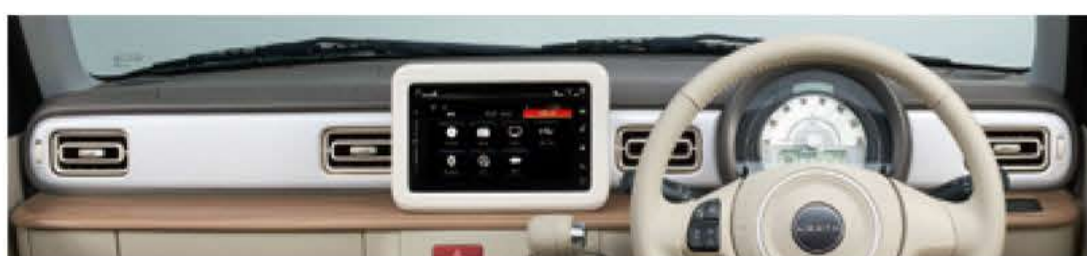
ホワイトカーボン調