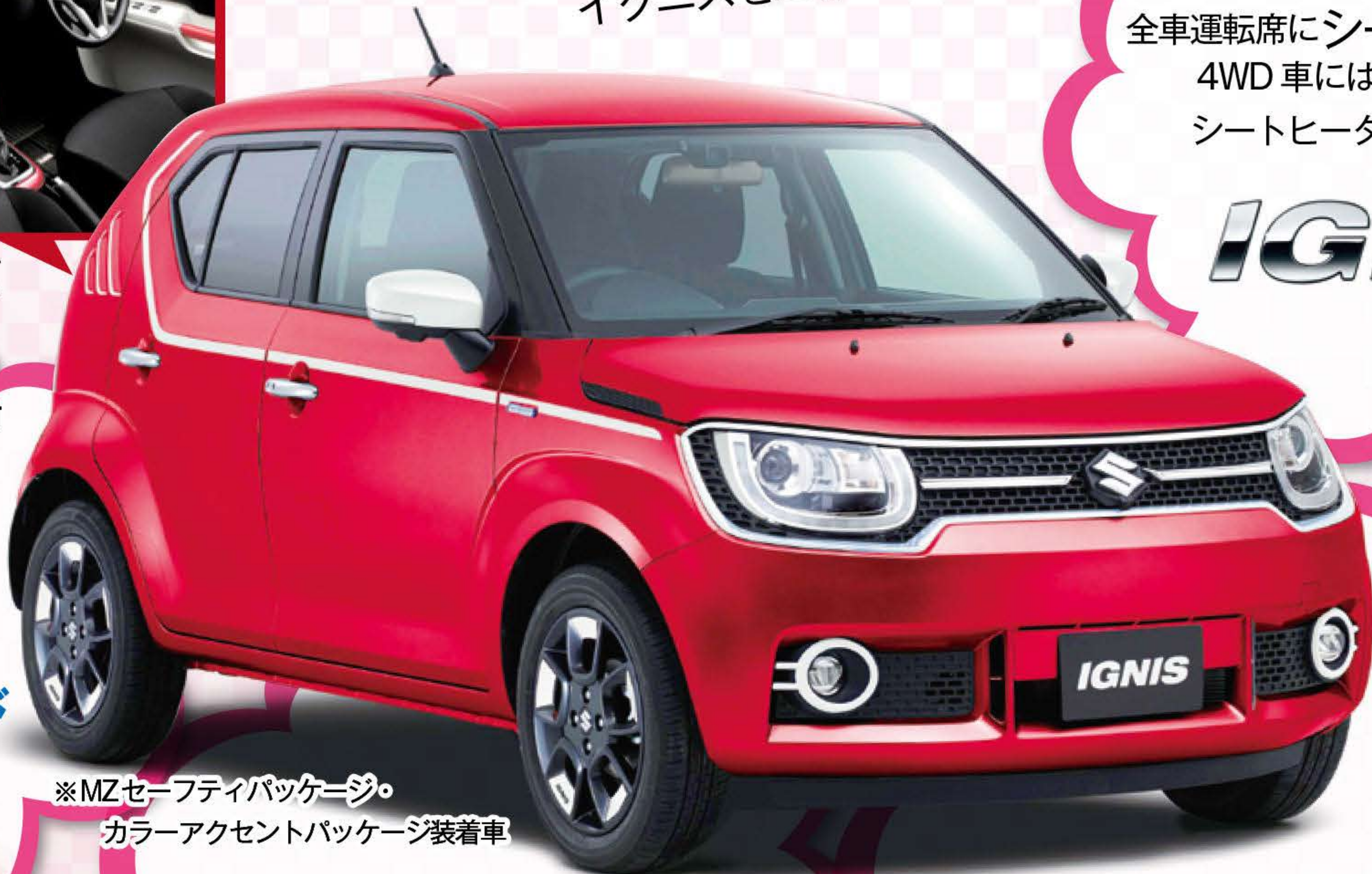
※MZセーフティパッケージ・ カラーアクセントパッケージ装着車