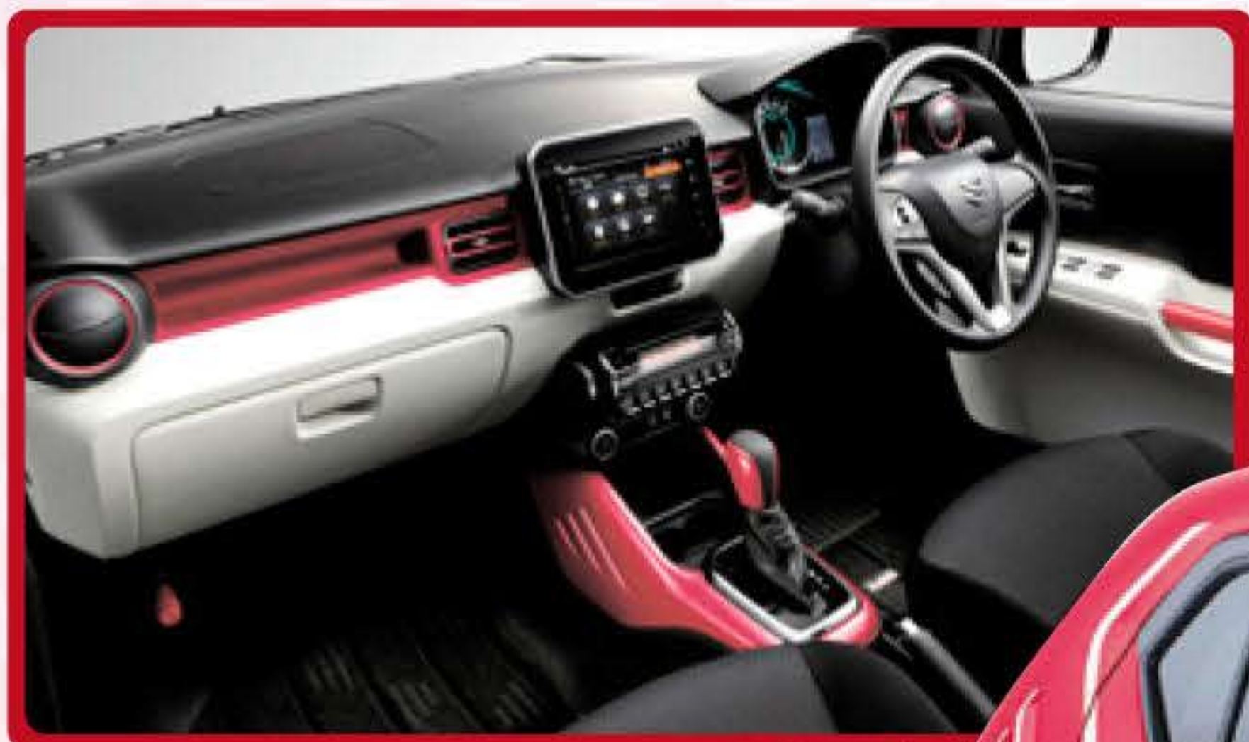
※MZ 全方位モニター付メモリーナビ・ カラーアクセントパッケージ装着車

普通車って大きくて扱いにくい？ 小回りもきかないんじゃない？ 軽の方が燃費いいんじゃない？ そんな女性の方にもおすすめの イグニスをご紹介します。