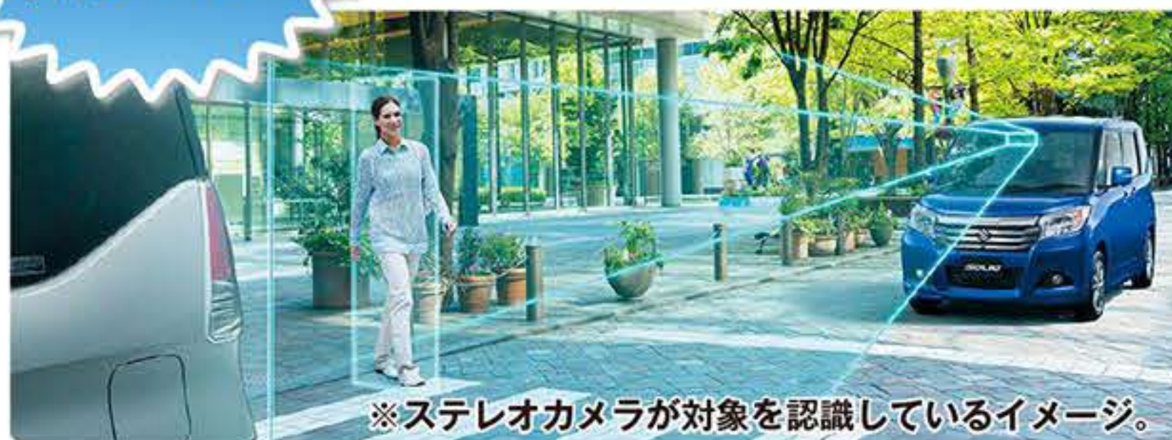
※ステレオカメラが対象を認識しているイメージ。

2つのカメラで人もクルマもキャッチ! また、車線の左右の区画線もキャッチする など、カメラからのさまざまな情報をもとに、 警告や自動ブレーキで衝突回避をサポートします。