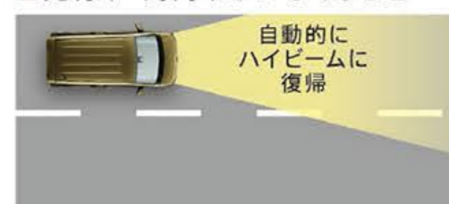
自動的にハイビームに復帰

ヘッドランプのハイビーム/ロービームを自動で切り替えて夜間の安全走行をサポート!!