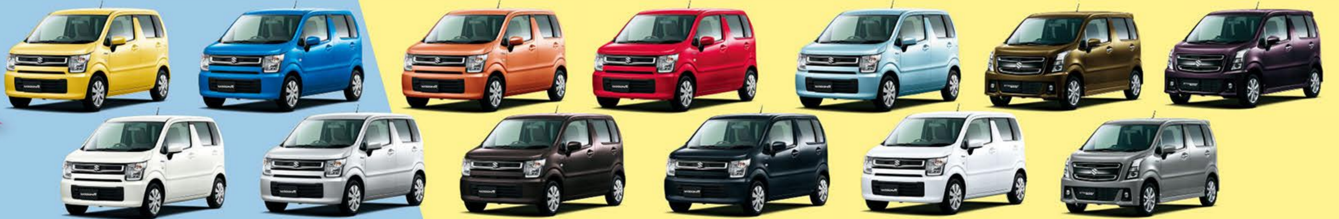
※カラー構成は、グレードによって異なります。