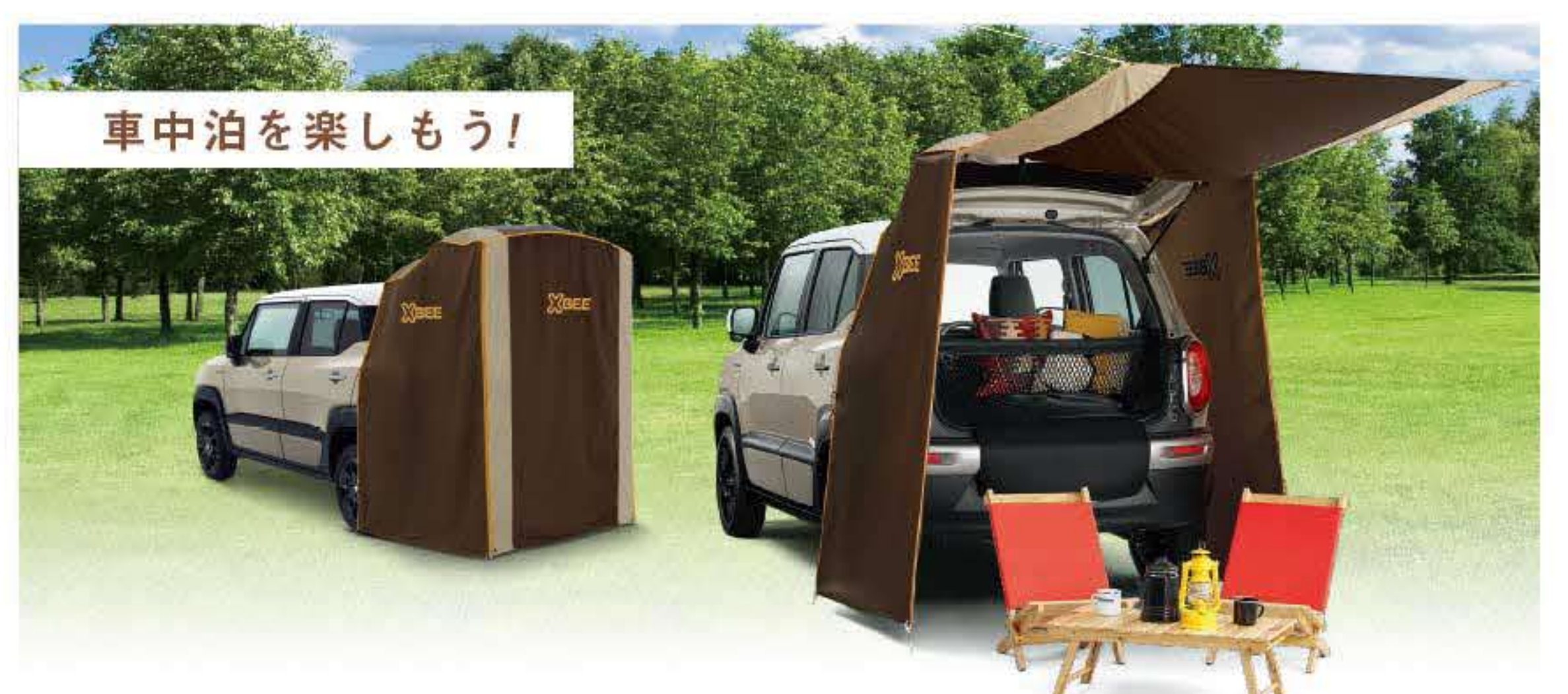
写真: HYBRID MZ アクセサリー装着車 ボディカラー: キャラバンアイボリーパールメタリック ホワイト2トーンルーフ(C7G)