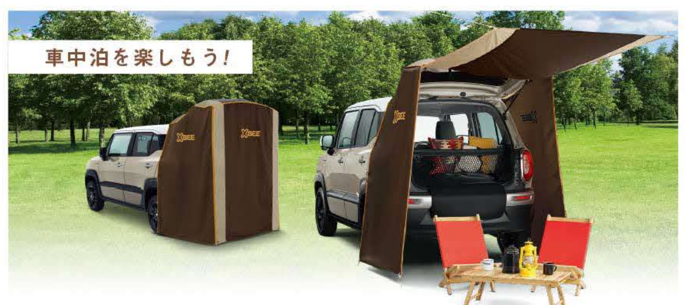
写真: HYBRID MZ アクセサリー装着車 ボディカラー: キャラバンアイボリーパールメタリック ホワイト2トーンルーフ(C7G)